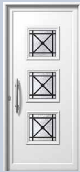
E731 TZAMIA ΑΣΦΑΛΕΙΑ 1