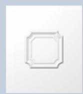
E538 ΤΥΦΛΟ 900x1050 900x2100