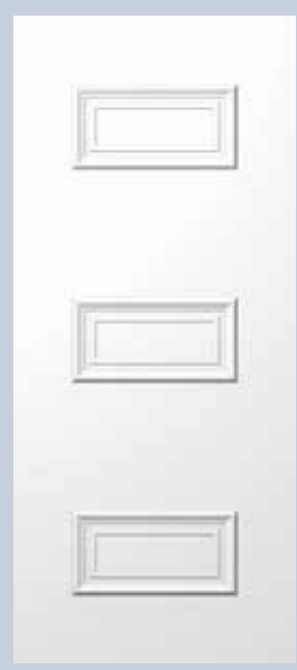
E794 ΤΥΦΛΟ 900x2100