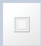
E596 ΤΥΦΛΟ 900x1050 900x2100