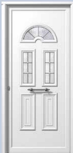
E983 ΑΣΗΜΙ ΚΑΪΤΙ