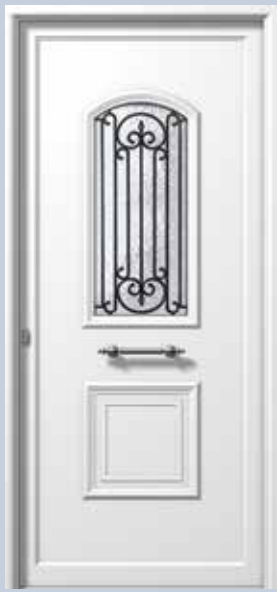
E771 TZAMI ΑΣΦΑΛΕΙΑ 1