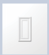
E597 ΤΥΦΛΟ 900x1050