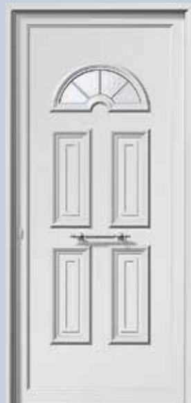
E981 ΑΣΗΜΙ ΚΑΪΤΙ