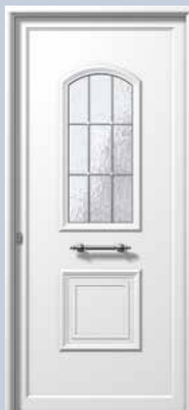
E771 ΤΖΑΜΙ ΑΣΗΜΙ ΚΑΪΤΙ